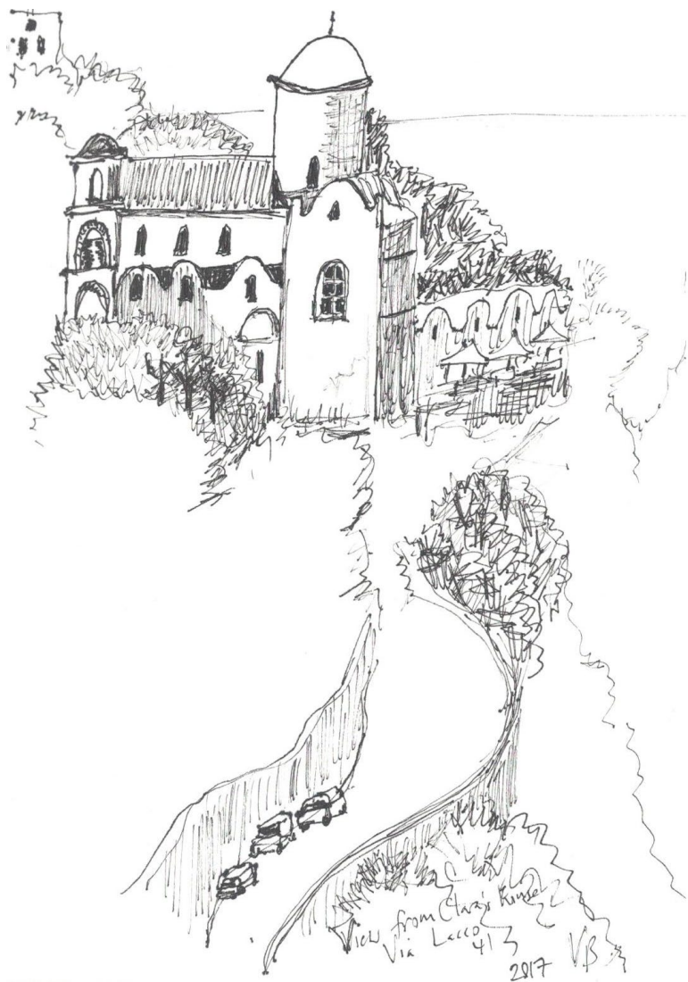
Ravello: Church of Santa Maria a Gradillo, sketch by Victoria Bladen